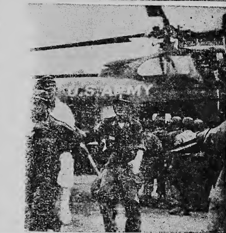
DE HELICOPTERS in Korea werden weer overtime. Dit keer voor zeer menslievend werk, het wegvoeren van de gewonde en zieke vrijgelaten gevangenen. Nog nimmer tevoren heeft in enige oorlog de soldaat zo'n uitstekende medische verzorging gehad als in deze.

Olieindustrielen in New York zijn van mening dat het in ieder geval nog minstens een jaar zou duren voordat de productie van Perzie kan worden hervat en dat tegen die tijd de toeneming van de vraag zal bijdragen tot de oplossing van de problemen rond de